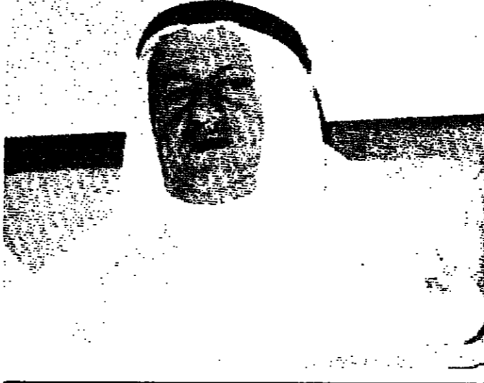
اجرى اللقاء : صمود السياتي

كذلك فان الشيء الجدير بالملاحظة هو العراقة التاريخية العمانية مجسدة في قلاعها